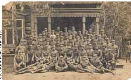
Výzvědná rota 6. hanáckého pluku v roce 1919 v ruském Omsku.

Snad každý Olomoučan zná Hanácká kasárna a ulici Hanáckého pluku. Mnozí slyšeli o 6. „hanáckém“ pluku ruských legií v první světové válce. Mnohem méně lidí však ví, že označení Hanácký pluk má výrazně delší tradici a že od druhé poloviny 19. století označovalo vojenský útvar, který vznikl již roku 1655.