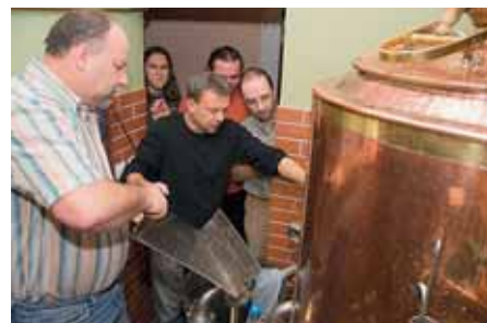
Pampaedie nabízí účastníkům mimo jiné i možnost seznámit se s přípravou piva.

Zájemci mohou také využít možnost darovat účast v kurzu někomu blízkému na základě dárkového poukazu. Převážná většina kurzů je určena začátečnickům v dané oblasti, a účast v nich je tak umožněna každému, kdo má zájem se o daném tématu něco dozvědět. Všichni dospělí bez ohledu na věk, vzdělání či profesi se