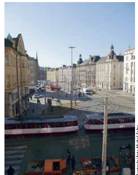
Ilustrační foto Michal Folta